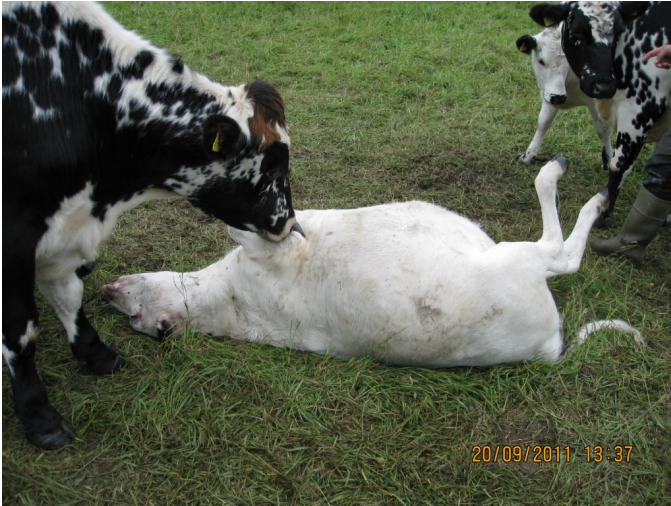
Kraftigt bett efter hörntand läppen uppsliten