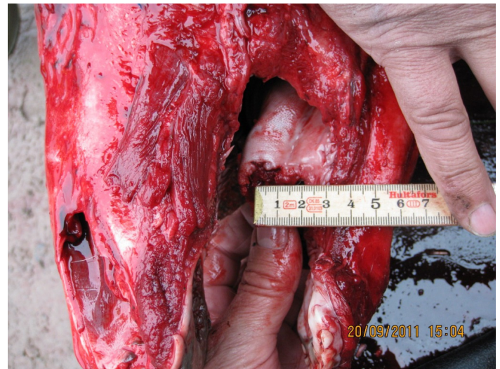
Tydliga avtryck efter delar av kindtändernas profiler 25 mm.