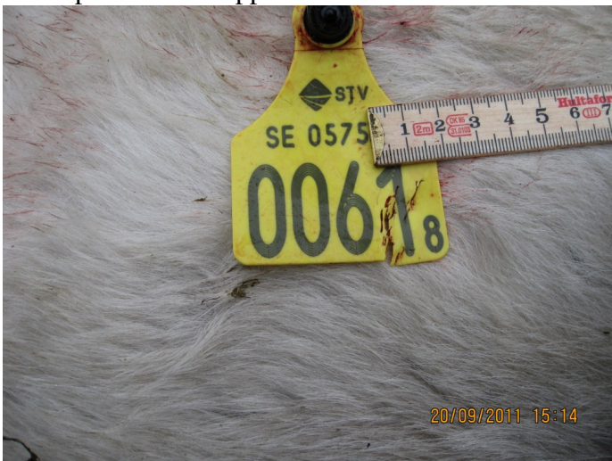
Märken efter kindtands- skärtandsbett bett i plastbrickan uppstod vid bittet i örat.